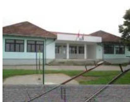
ИО ОШ „Брађа Рибар“, Брасина