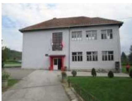
ОШ „Брађа Рибар“, Доња Борина